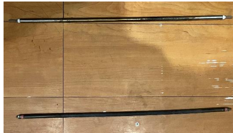
Gambar 2. Element Tubular

Pengujian dilakukan dengan mengisi wadah menggunakan air dengan dua kondisi awal, yaitu air dingin dan air biasa. Sebelum pemanas diaktifkan, suhu awal air dicatat terlebih dahulu. Elemen tubular kemudian diposisikan sesuai ketentuan pemasangan, dan sumber listrik dihubungkan melalui wattmeter untuk merekam energi listrik yang digunakan selama proses pemanasan. Setelah semua perangkat siap, pemanas dinyalakan dan kenaikan suhu air diamati pada interval waktu yang konsisten hingga mencapai suhu akhir target. Pada setiap interval, data suhu, waktu, dan konsumsi energi dicatat secara sistematis. Prosedur yang sama diterapkan untuk kedua jenis material, sehingga diperoleh data primer berupa profil kenaikan suhu, waktu pemanasan total, serta konsumsi energi listrik dari masing-masing elemen pemanas.